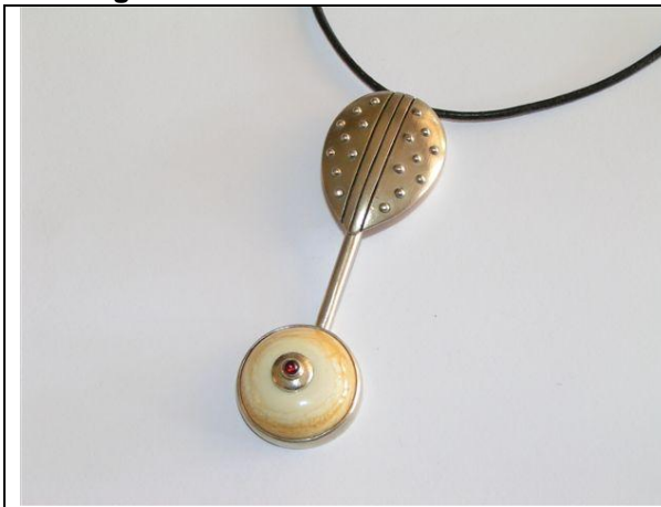
P2 (Silber, Glasperle „Ivory“, Granat. Länge Anhänger ca. 7cm) 520,- Euro