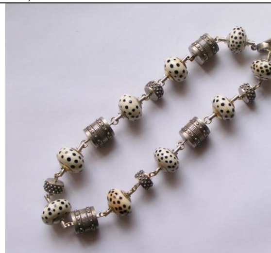
N1 (Silber, Glasperlen „Cheetah“, 18K Gold. Gesamtlänge Kette ca. 45cm) 1.300,- Euro