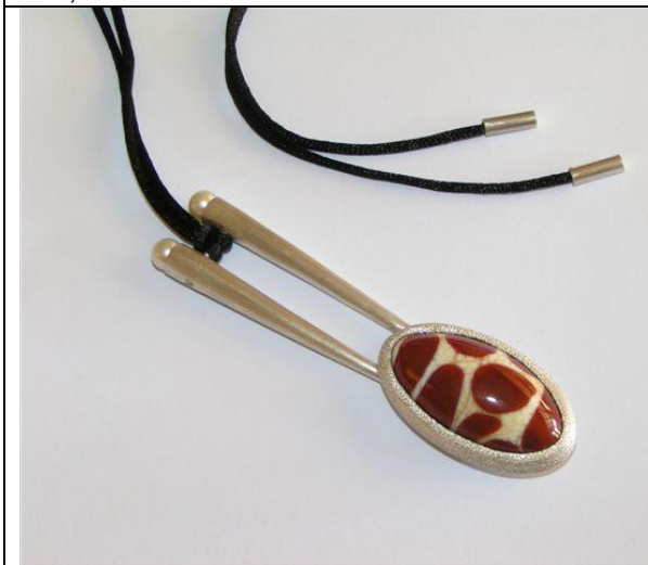
P9 (Silber, Glasperle „Giraffe“, Seawater Pearls. Länge Anhänger ca. 7,5cm) 570,- Euro