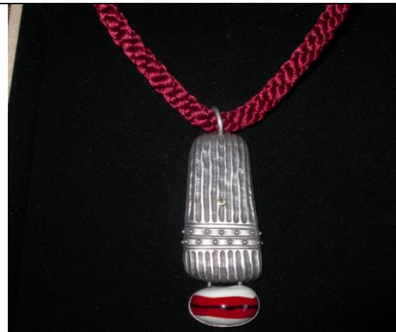
P5 (Silber, Glasperle, 18K Gold, Turmalin. Länge Anhänger ca. 7cm) 650,- Euro